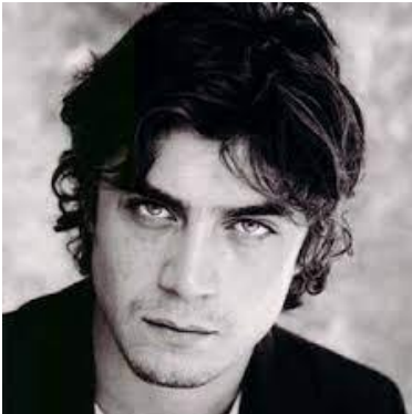
Riccardo Scamarcio = Elias