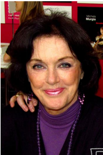
Annie Duperey = dame parisienne