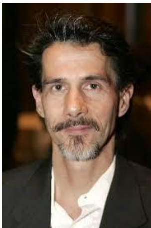
Lothaire Bluteau Daniel