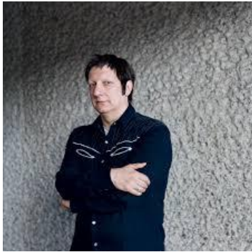
Robert Lepage René